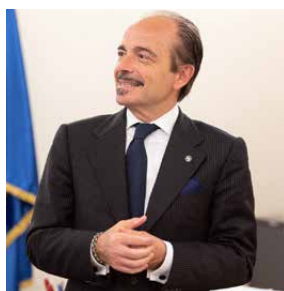
Alessio Butti , sottosegretario alla Presidenza del Consiglio con delega all'Innovazione

L e economie derivanti dai bandi del Pnrr, ovvero circa 1,5 miliardi di euro, saranno usate soprattutto per le «infrastrutture 5G di nuova generazione». Lo chiarisce Alessio Butti, sottosegretario alla Presidenza del Consiglio con delega all'Innovazione in un'intervista a DigitEconomy.24, report del Sole 24 Ore Radiocor e di Digit'Ed, nuovo gruppo attivo nella formazione e nel digital learning. Parlando dell'implementazione del 5G, Butti sostiene che un punto di equilibrio tra esigenze di salute pubblica e sviluppo può essere rappresentato dall'allineamento dei limiti italiani